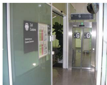
写真2:シェンゲン協定加盟国への乗継用税関窓口